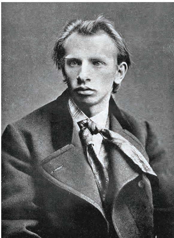
Mladý Jaroslav Vrchlický (vlastním jménem Emil Frída) v době veltruské, kdy psal Rytíře Smila.

Přesto, nebo možná právě proto, se Rytíř Smil těšil od začátku velké oblibě. Báseň se v ústním i rukopisném podání tradovala po celá desetiletí. Kvůli tomu se také počet slok i samotné verše v jednotlivých verzích liší, stejně jako informace o roku prvního vydání (snad 1925, tedy třináct let po básnickově smrti). Jisté je, že už za první republiky byl Rytíř Smil vydáván opakovaně, stejně tak tomu bylo po sametové revoluci.