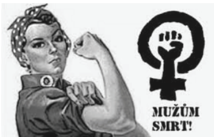
Neomarxistický feminismus rozvrací rodiny a ... pravvprost.cz

Noviny nepodporují ani BLM, ani migranty ani islám - dokonce o nich píše negativně a nechválí je. Což je pravda! A dodávám, nepodporujeme ani marx-leninismus, nacismus a podobná zvěrstva. I když tiskneme články, s kterými nesouhlasíme, a to proto, abychom informovali čtenáře. Pak jsem pochopil, slečnin „avatar“ (Avatar je postava, znak, obraz nebo model, který se používá ve virtuální realitě k vlastní reprezentaci uživatele.) na Facebooku - „dělnici - úředníci s šátkem na hlavě, ukazující svaly na ruce, velice podobný tomuto obrázku