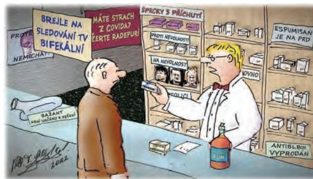
„DO HUBY, PANE CHROUSTALI - NEŠPEKULUJTE, PROČ SE TOMU ŘÍKÁ ANAL-GETIKUM, A PŘÍŠTĚ TU TABLETU PROSTĚ STRČTE DO HUBY A SPOLKNĚTE!“

Toto číslo jest posláno do tiskárny 6.června Léta Páně 2022