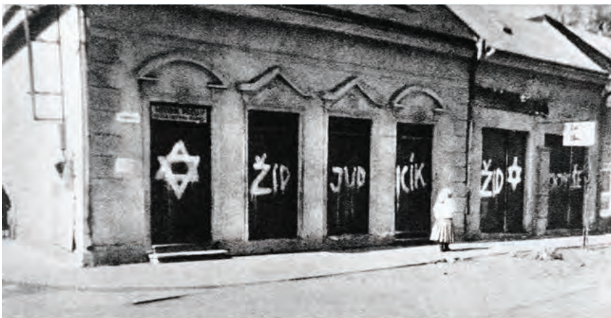
Na Židov útočili už pred vznikom fašistického Slovenského štátu.