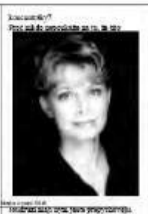
... (Caption text, partially obscured)

S lovo vydavatele: Vážení čtenáři, vítám vás u prvního čísla Novin. Jsme rádi, že se vám můžeme představit. Noviny jsou určeny především pro krajanstvo v Austrálii a okolí. Jsou to místo, kde můžete najít informace o dění v naší vlasti, o životě našich krajanů v zahraničí, o kulturě a tradicích. Jsou to také místo, kde můžete vyjádřit svůj názor na některé problémy a sdílet své zkušenosti. Jsme si vědomi, že Noviny budou pro vás důležitým zdrojem informací a inspirace. Děkujeme vám za vaši podporu a těšíme se na vaše reakce.