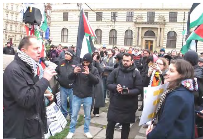
Politická špička u pomníku J. Palacha. Sejmuto z poledních Zpráv ČT 16.1. 2025 v 11:17

A hele, není to na tom výřezu z televizní reportáže ten chlápek, co mi vloni pokazil 17. listopad?