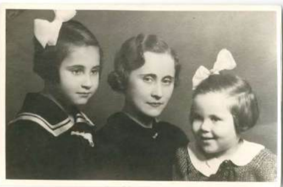
s matkou a mladší sestrou, Prostějov 30. léta