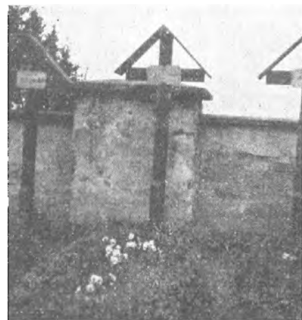
Tak vypadají hroby kněží řeholníků na Moravci.