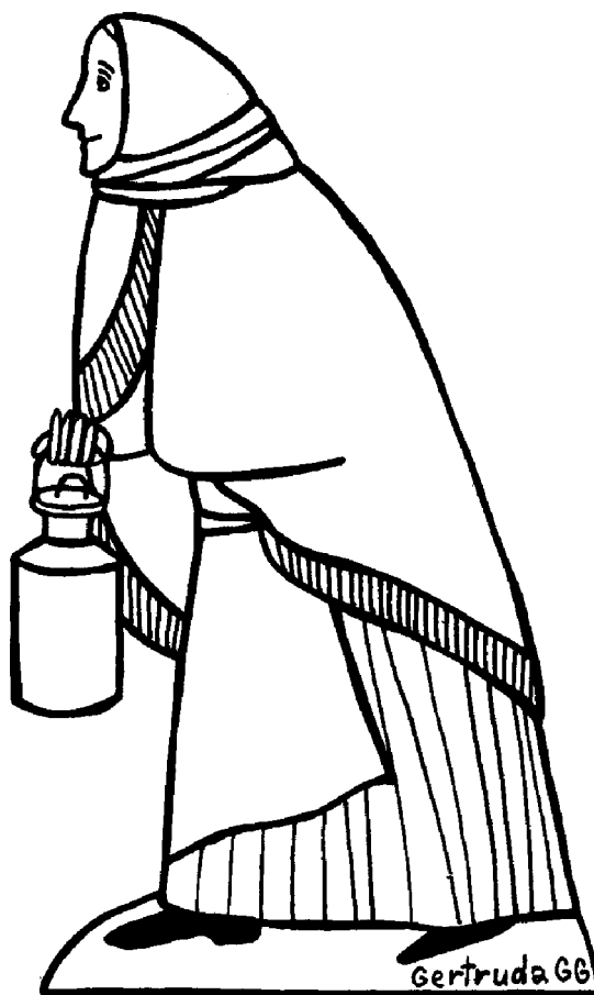
Z figurek k betlému: Žena s mlékem

Podívej se na mapu Ruska. Zamysli se nad dvěma sty milionů, které tam bydlí. Jdi prstem po této rozsáhlé zemi: tady teče Volga, tam je Kyjev, Moskva, Ural, Vorkuta, Sibiř... Na všech místech, po kterých jde tvůj prst, bydlí lidé a trpí. Tvůj prst se zastavil u krvácejícího Ruska. Buď dobrým Samaritánem! Nalij olej své lásky a vína své modlitby do otevřených ran. Modli se a učin si obět alespoň za jednu bloudící duši, abys jí vyprosil milost a sílu k obrácení; alespoň za jednoho pronásledovaného, abys mu vymohl sílu k mučednictví.