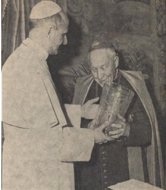
ŘÍM. — Kard. Beran odevzdává sv. Otci vázu z českého skla s vyleptanými podobiznami českých nebeských patronů.

kterého se mu dostalo v Římě; děkoval mu za to, že ho jmenoval kardinálem; kněží i věřící ve vlasti přijali toto jmenování s radostí a považují to za poctu pro celou zem. Jejich jménem kard. Beran ujistil sv. Otce nezdolnou láskou a oddaností, pro ně pro všechny vyprošoval na sv. Otci apoštolské pozhnání. Jako projev vděčnosti daroval sv. Otci velkou vázu z českého skla s vyleptanými podobiznami svatých českých patronů.