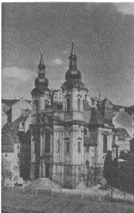
KARLOVY VARY. — Kostel sv. Maří Magdalény.

Svatá stolice a africká republika Keňa navázaly diplomatické styky. Při Svaté stolici je zastoupeno 54 států. — Od guvernéra města Bombaje sv. Otec dostal na památku své návštěvy v Indii dvě lvi mláďata ; byla darována zoologické zahradě v rodišti sv. Otce Breseii. — Vatikánské pošty vydaly dvě známky k vyhlášení sv. Benedikta nebeským ochráncem Evropy; na jedné známce je zobrazen sv. Benedikt podle obrazu Perugina a na druhé je pohled na obnovené benediktinské opatství Monteassino. Svátek sv. Benedikta, patrona Evropy, se mohl letos slavit poprvé 11. července.