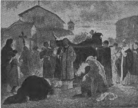
ŘÍM. — Přenesení tělesných pozůstatků sv. Cyrila do baziliky sv. Klimenta. Tuto fresku vidíme v kapli našich věrozvěstů, postavené z pověření papeže Lva XIII.