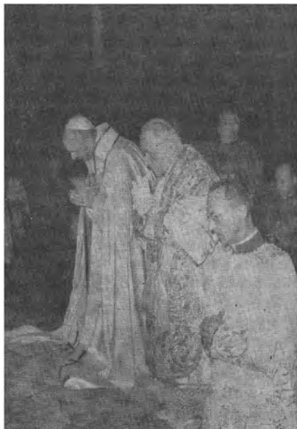
ŘÍM. — 30. června pražský arcibiskup kard. Beran sloužil v bazilice sv. Petra mši svatou k druhému výročí papežské kronovace. Na obrázku vidíme kard. Berana se sv. Otcem při stupňových modlitbách.

(40) G. B. DE ROSSI, Del sepolcro di S. Cirillo nella basilica di S. Clemente , Bollettino di Archeologia Cristiana , ser. I, I (1863), 9-10.