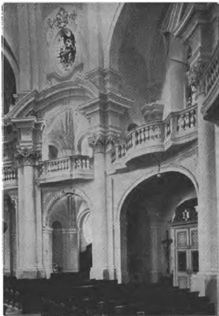
KARLOVY VARY. — Vnitřek kostela sv. Maří Magdalény.

Ale výtvarnou slávou města je kostel sv. Maří Magdalény od Kiliána Ignáce Diezenhofera (1731-1736). Uprostřed města, kde se říčka Teplá náhle otáčí, stál původně malý gotický kostelík. Diezenhofer starý kostel zbořil a volného místa použil k smělé, urbanisticky pojaté koncepci. Z terasy vyrůstá mocná fasáda chrámu, svíraná dvěma věžemi. Střední vzdutý risalit se plasticky umocňuje do středu a zvláště do výše, a je zakončen pádnou oblou rozeklanou římsou, jež přepadá dopředu, a tak kontrastuje s opačným pohybem narůstajícího terénu. Bohatě členěné bání věží jsou v souzvuku