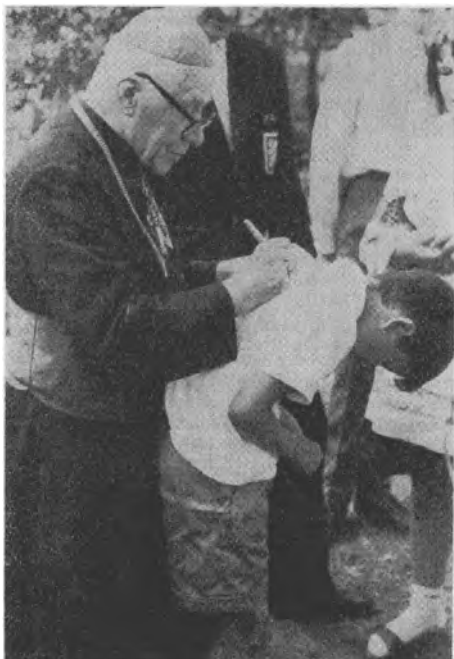
NORSKO. — Kard. Beran uděluje na táboře Čs. dálkové školy autogramy