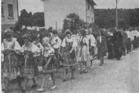
FRANCIE. — Darcey. Průvod ulicemi měřtu do řarňhoř kostela ke naší svátě, kterou sloužil 25. řevřene pražský arcibiskup a řeský primas kard. řeran pro řeti z letního řarbra a naše francouzské krajanu (viz NŽ řtr. 225).

V Sotto il Monte, v řodřiti papeže Jana, byl otevřen řřstav pro vřehovu misionářů. Papež Jan, po řeměži je řřstav pojme-