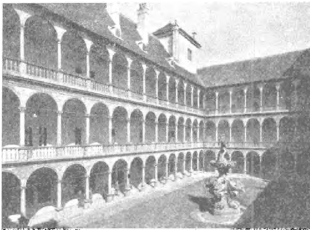
BUČOVICE. — Nádvoří zámku.