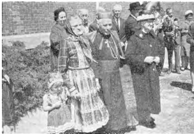
Kard. Beran v... PLZNI, ale v severoamerickém státě Wisconsin. Místní Češi pocházejí z přistěhovalců z Mrákova na Chodsku a v chodském kroji je oblečena babička i se svou vnučkou.