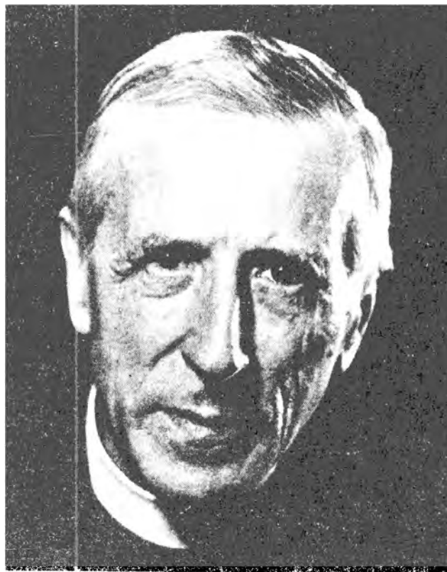
PETR TEILHARD DE CHARDIN

Vzpomeňme alespoň jednu zdánlivě bezvýznamnou událost, která však jasně svědčí o Teilhardově apoštolské práci. Prvního ledna roku 1932 účastníci slavné vědecké výpravy — známé pod jménem » žlutá okružní cesta « — slaví Nový rok v čínské misijní stanici Lingchov. Začíná se mší svatou. Naskytuje se tu nezvyklý, snad jediný obraz : početná skupina vědců a badatelů, skoro všichni nekatolíci, v hlubokém usebrání obklopuje oltář, na němž obětuje páter Teilhard. Zcela samozřejmě ho pokládají za duchovní hlavu výpravy. Liturgický obřad nepůsobí vůbec umělkovaně. Otec Teilhard ho prožívá jakoby zevnitř, rozvíjí ho harmonicky a nenuceně tak, aby všichni přítomní mohli prožívat tajemství eucharistie. Vznešená prostota a prostá vznešenost mešní liturgie si podmaňuje geology a paleontology světového formátu. Nikdy nezapomenou na tyto nádherné okamžiky prožité u Teilhardova oltáře. S velkou pozorností a s duchovním hladem naslouchají krátké promluvě na evangelium toho dne. Teilhard dovede vyložit biblické slovo tak, aby proniklo až na dno