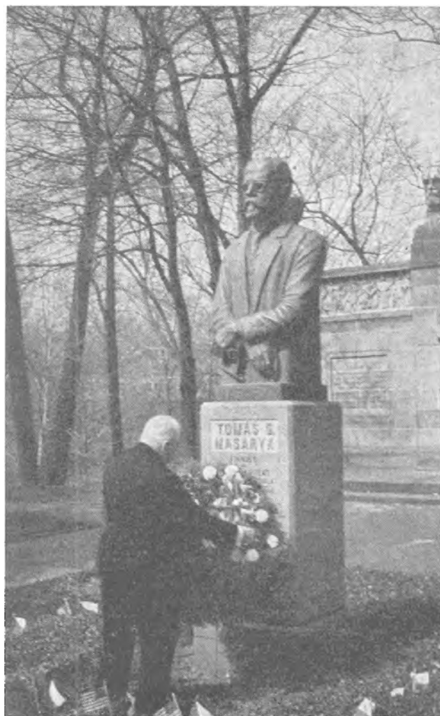
KARD. BERAN v České kulturní zahrádce v Clevelandu

Tím jste se dotkl nejbolestivějšího místa celého problému. Abychom to lépe pochopili, můžeme rozdělit nekatolické partnery katolíků na dvě skupiny: První pokládá všecka náboženství za více méně rovnocenná, za rozličné cesty k témuž Bohu. Takovému člověku ovšem ty závazky o katolické výchově dětí nepůsobí zvláštní potíže. Víte asi, že katolický sňatek uzavřel např. český bratr dějepisec Palacký s katolickou dcerou advokáta Měchury: vyžadované záruky podepsal a čestně je plnil. — Ale je druhá skupina nekatolíků, kteří jsou ve svědomí přesvědčeni o pravdě jen svého náboženství. Jak může takový hluboce věřící nekatolík přistoupit na záruky, že děti budou vychovávány katolicky? Vždyť by tak jednal proti svému svědomí — a tedy hřešil! A právě zde