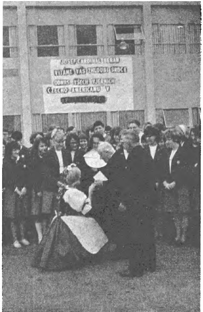
Kard. Berana vítají v » CEDAR RAPIDSÍCH « studentky katolické střední školy též českým nápisem, jak si to ještě zapamatovaly od svých rodičů.

Vůči tomuto pohledu na lidské dějiny, jehož zárukou je sama Pravda a v němž je přítomen Kristus — » Kristus včera, dnes a na věky « — marxisté ještě víc než unavení tradicionalisté připadají jako jen a jen lidé z včerejška.