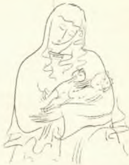
Ze sbírky "Přeten Třeboňské madoně "