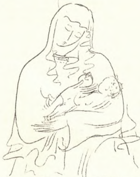
Ze sbírky "Přeten Třeboňské madoně"