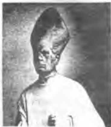
Model sochy sv. Jana Nepomuka Neumanna v České národní kapli

Je vystavěna ke cti prachatického rodáka, Jana Nepomuka Neumanna, svatořečeného sv. Otcem Pavlem VI. v r. 1977. Kaple se nachází v největší z celkem 57 kaplí a oratoří basiliky a je to osmá národní kaple v ní. Stavba a umělecká výzdoba stála okolo 600.000,- $ a její posvěcení bude velikou událostí. Očekává se velká účast biskupů, kněží a věřících. Má se zúčastnit i pražský arcibiskup kardinál Tomášek a pozván je také prezident USA Reagan, který by měl promluvit v předvečer posvěcení kaple, tj v sobotu 25. června tr. Hlavní slavnostní bohoslužby se budou konat den nato, v neděli 26. června v poledne.