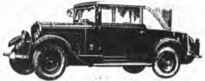
Moderní čtyřválec „Skoda-1300“, s čtyřsokolovým kabrioletem

RŮZNÉ TVARY AUTOMOBILŮ, VYRÁBĚNÝCH DOMÁCÍMI ROVÁRNAMI.