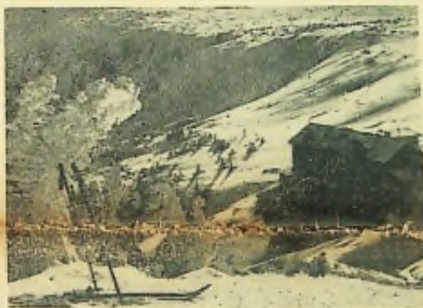
THERE IS WINTER NOW IN CZECHOSLOVAKIA

Znamená to dalekosahle rozvinutí australského hospodářství ve všech směrech, tedy i dobré možnosti podnikání. I když pristehovaleci mají určité potíže, přece jen, jak ostatně dokazuje vzrůstající počet našich československých podnikatelů, zdravá myšlenka a usilování na práce vede k úspěchu. J. B.