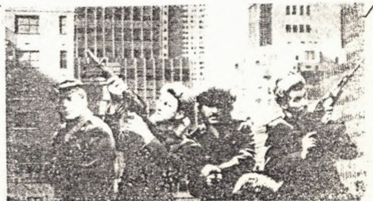
Frankie Goes To Hollywood