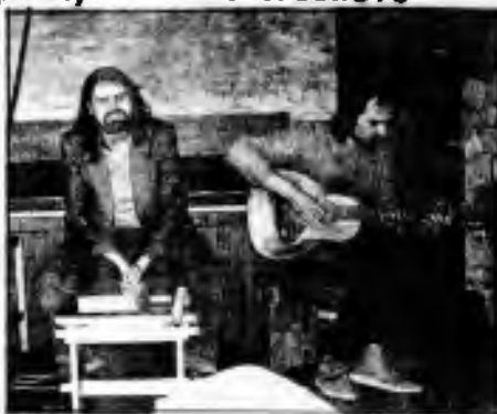
M. Princ a spol.