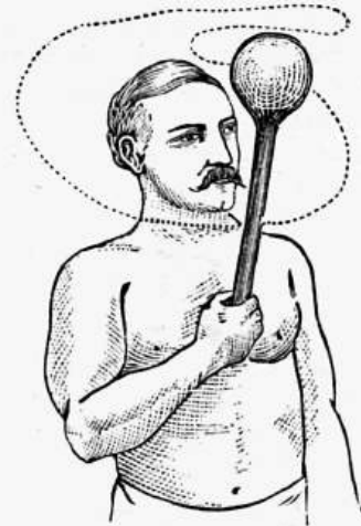
Jedno z obtížnějších cvičení kuželových.

„Nejtěžší cvičení činkové zdá se býti jednoduchým a dosti snadným diváku nezkušenému. Žák pouze zvolna rozpažuje a připazuje. Dejte však takovému „zelenému“ vykonati cvičení to jenom tucetkrát za sebou s párem činek čtyřliberních a jistě že se mu bude zdát, že každá ta činka váží sto liber.