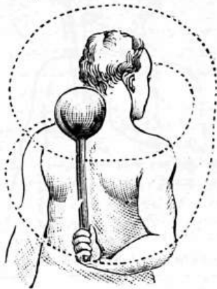
Poslední Girardovo cvičení kuželové.

„Žádný hoch neměl by být připuštěn v žádné tělocvičně ku cvičení bez cvičitele, jenž práci jeho má řídit a sledovati. Zná mnoho případů, že mladí lidé byli přímo zabiti nesprávným a nerozumným cvičením v tělocvičnách. Přijde-li hoch poprvé do tělocvičny, bývá obyčejně jeho snahou hned něco dokázati, co viděl u starších žáků neb atletů. Neníli stráženo odskočí ku hrazdě, bradlům, kruhům neb hrazdě visuté a snaží se obyčejně z tichého visu učiniti výmyk neb výšin. Při tomto pokusu přepne obyčejně dosud utlé a velmi lehce poranitelné svazy v bocích a vydává se v nebezpečí různých nemocí. Mnoho hochů zemřelo již na zánět plic a součotě, jež původ svůj vzaly v takovémto nerozumném cvičení, jež zkoušeno neb prováděno bylo dříve, nežli tělo k tomu spůsobilé bylo.