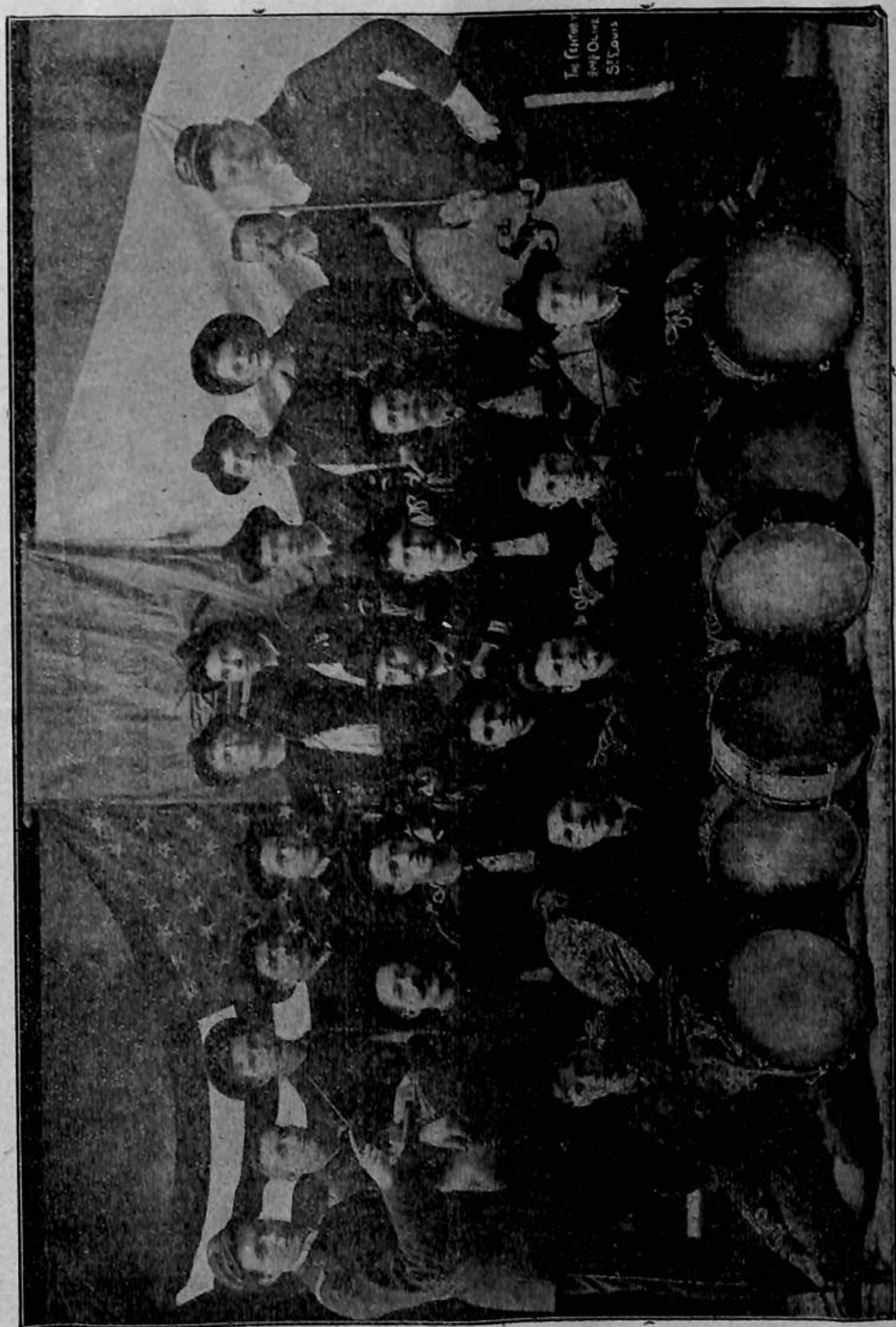
Četa trubačů a bubeníků T. J. Sokol v St. Louis, Mo.