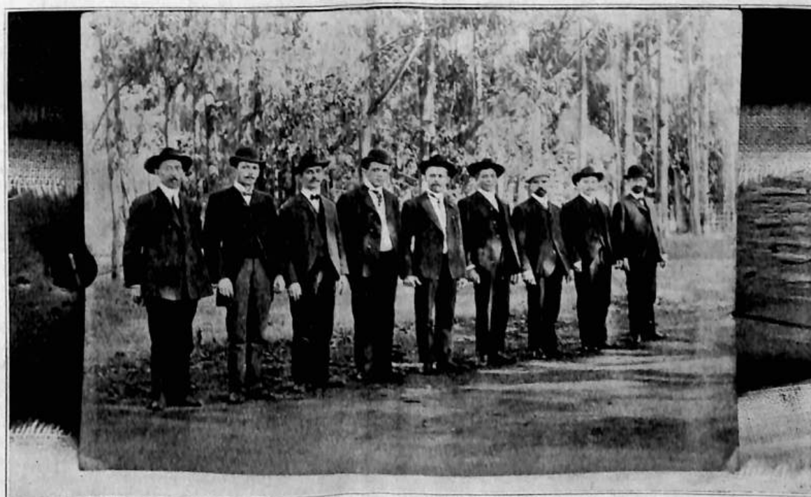
Zakládající členové T. J. S. v San Franciscu, Cal.

kon jeden, který povinným výkonem pro všechny závodníky se stane.