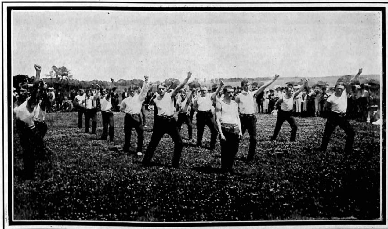
Cvičení prostná, sokolové, při státních závodech v Bruno, Neb.