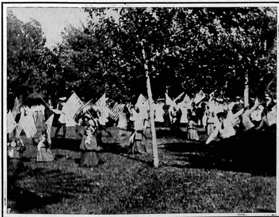
Žáci ažačky T. J. S. Podlipný na veřejném evičení při závodech Župy Severo-východní v Detroit, 4. července 1905.

dé o sobě stojí, prospívají dost utěšeně, leč to právě je nejpádnějším pro to dokladem, že mají se spojit, aby v jednom šiku, v pravé bratrské shodě sokolské, jedni o druhé se opírajíce ve všech potřebách společných, prospívaly velkolepě, unášivě. Vyvinují-li každá zvláště pěkný život, jak krásný vzejítí by musel z jejich spojení! A vše pro lepší zdar a prospívání celé národnosti naší. Sbory sokolské a jich Jednoty budou pomalu jedinými představiteli organizací ryze národních, žádné účele hmotné prospěchové nesledující, a lze-li tedy od koho upřímnou a opravdovou péči o náš pokrok národní a duchovní očekávati, je to od našeho Sokolstva. Důležitý je jeho úkol těloevičný, ale i též národní a osvětný. K vůli všem musí každý věrný našinec přátí mu zdar v jeho počínání a z plna srdce doufati v uskutečnění chystaného Svazu, jímž teprve činnost našeho Sokolstva žádoucího vrchole dosáhne."