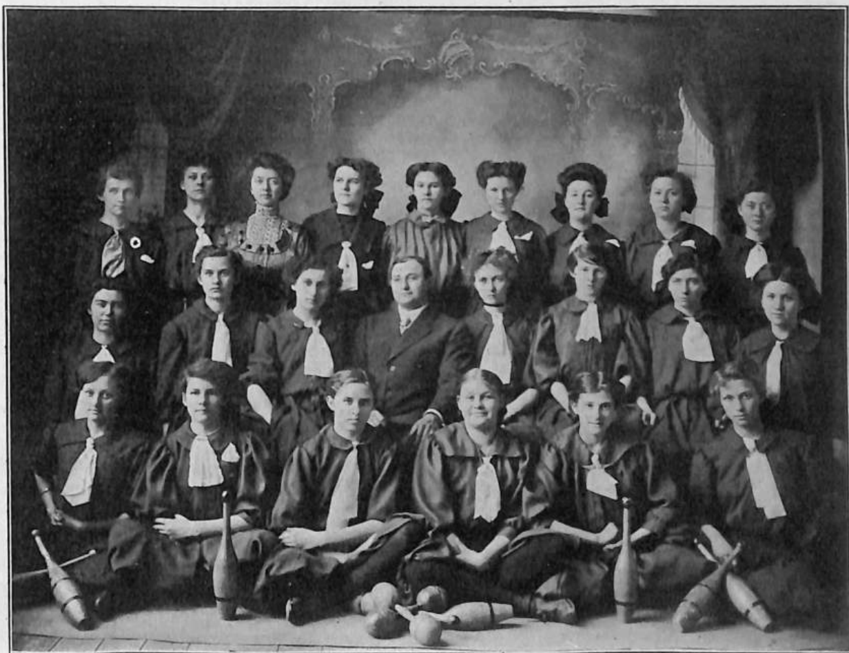
SOKOLKY T. J. S. RAVENNA, NEB.

Schopnému cvičiteli poskytnuta zde jest příležitost osvědčiti svoji obratnost, jako jest s to v čas danými povely udržovati obě družstva v činnosti. Sokolové poznají, jakými eviky otužují se Sokolky, Sokolky zase budou viděti, jak jich uhlazené eviky líší se od odměřených, rázností i silou vynikajících cvičení Sokolů, a cvičitelové učili by se jeden od druhého, jak cvičení vésti. Kde se cvičitelské schopné síly nedostávají, tam číslo takové ovšem odpadnouti by musilo. Dorost, rozdělený na stejná družstva, mohl by závoditi chvíli v přeborných hrách, na to asi dvacet minut společně cvičení na nářadí a na