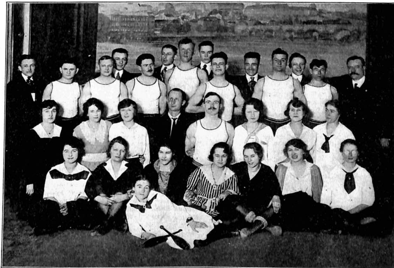
Účastníci kursu okrsku minnesotského.

sehnáním toho dolaru — a proto problém tento jest vážným pro budoucnost mnohých jednot a příští sjezd měl by věci tuto řádně probrati. — Buď rozvrhnutí členstvo na činné a přispívající, kde by tato druhá třída členstva byla více peněžním činitelem a svými příspěvky značně vyššími hleděla udržeti zdravou rovnováhu prostředků našich jednot, aneb najíti cesty jiné, aby nebylo třeba činnost zábavní u jednot do takové míry uváděti. Prvým účelem Sokolstva musí býti národní výchova, a pak účel společenský. — Činnost naše vzdělávací byla omezena čistě na používání knihovny, neb dramatický odbor v místnosti naší nemůže působnost rozvinouti a od přednášek po několika nepodařených pokusech v letech minulých upuštěno. Pře by bylo ale záhodno, by letos znovu učiněn nový náběh a uspořádána jedna neb dvě přednášky ještě v tomto zimním obdo-