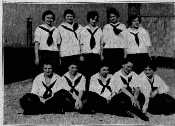
Závodníci a Sokolice z Chicaga, vyslané na 7. slet všesokolský v Praze.