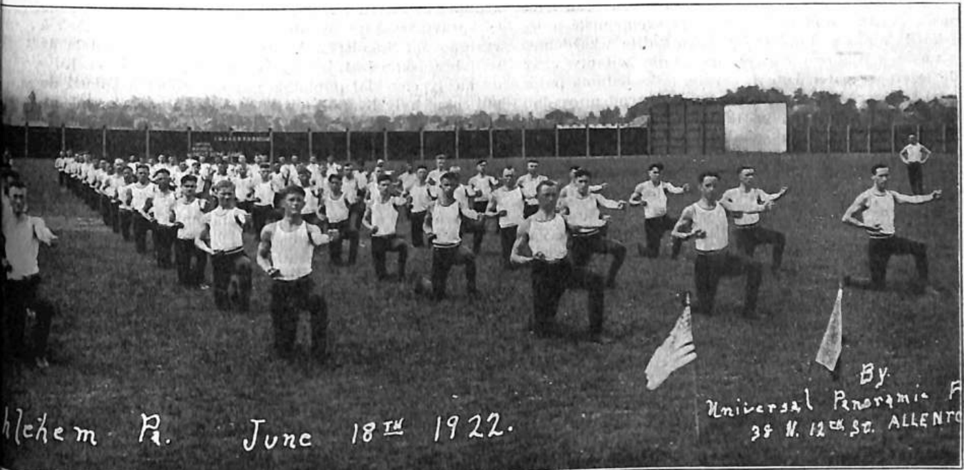
Bethlehem Pa. June 18 TH 1922.