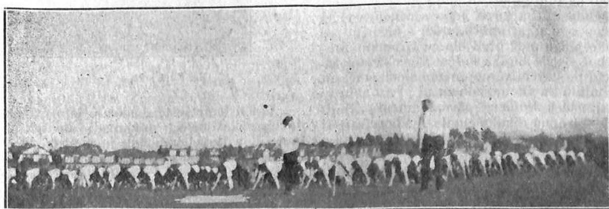
Cvičení Sokolic o sletu.

3. Dorostenci s tyčemi (celkem 64) nastupují čtyřstupem, štípi se ve dvojstupy zevnitř protichodem a od dol. mety dvojstupem zřízen rozstup do hloubky. Rozstup do šířky na úkroky byl částečně pokažen. I. a II. oddíl přecvičen dobře, zákryty zachovány, III. v polohách poněkud nestejný. a IV. až na dva opožděnce proveden celkem dobře. Odchod dvojstupy do-