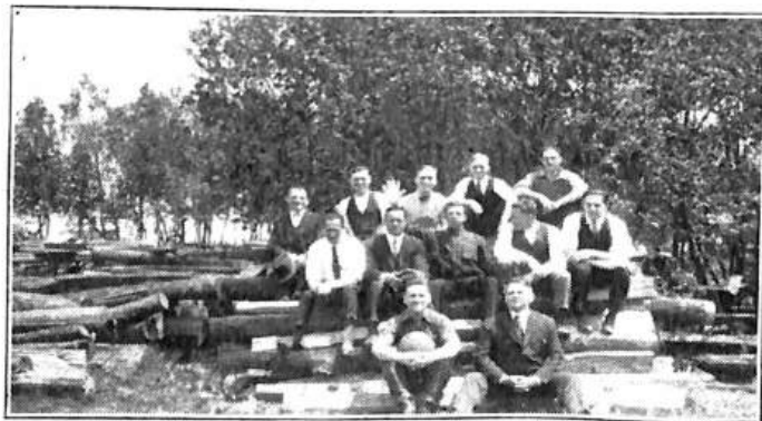
Z pěšího výletu do Flushing, L. I.