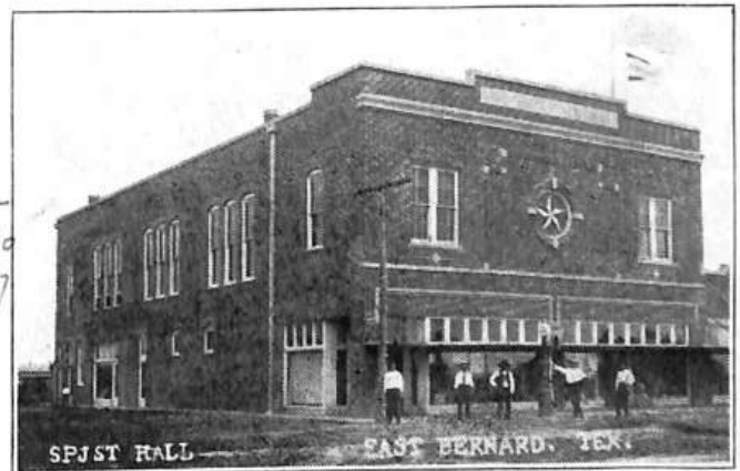
Síň spolková v East Bernard, Tex.