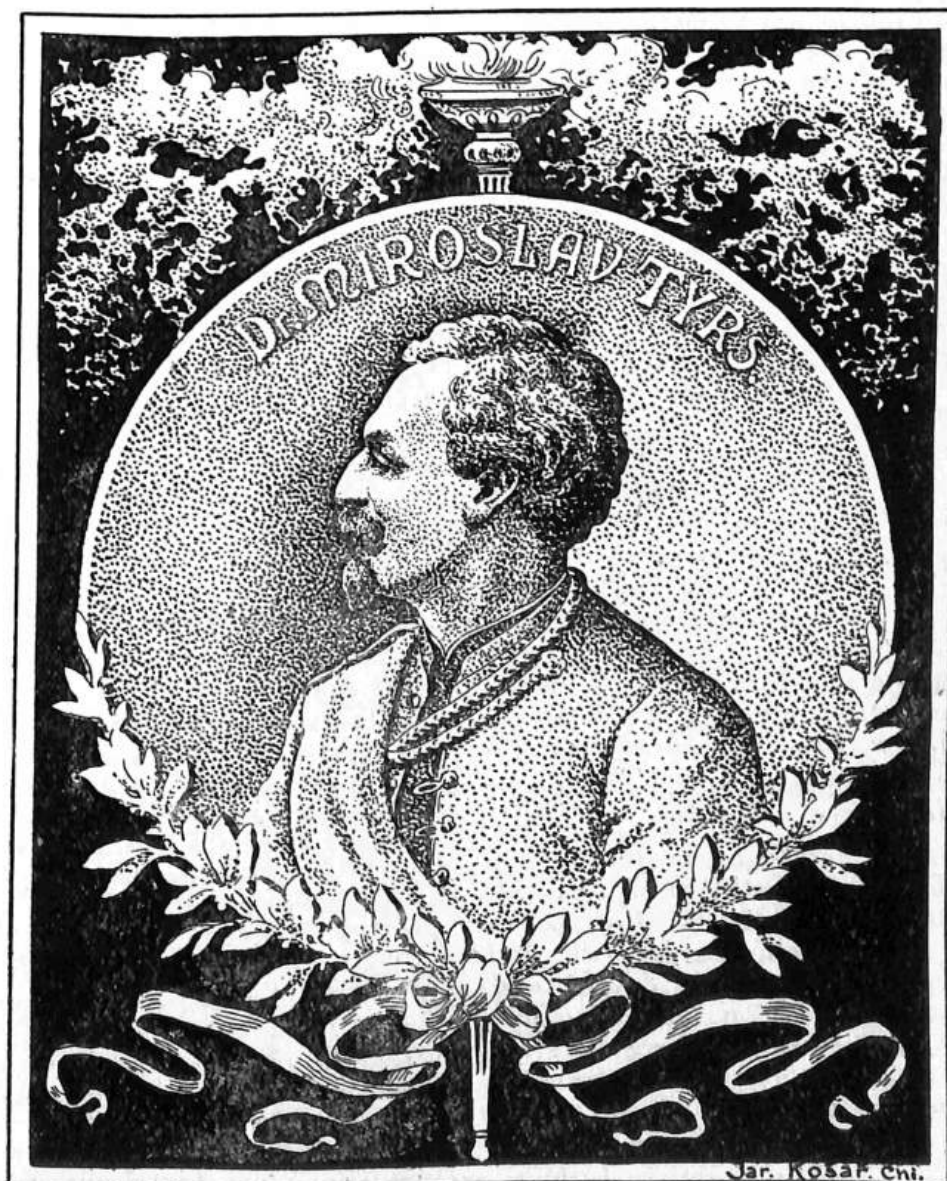
DR. MIROSLAV TYRŠ, narodil se 17. září 1832 v Děčíně, zemřel 8. srpna 1884 v Tyrolsku.