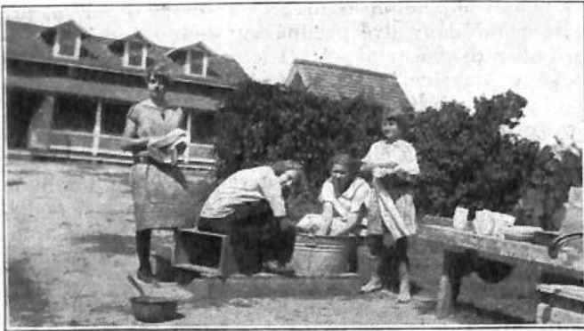
Z letního tábora Sokola New York. (Po obědě.)