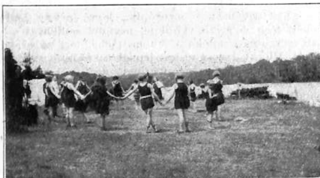
Z letního tábora Sokola New York. (Hry při koupání.)

Až toto se stane, přestane bédování a volání po pomoci, poněvadž poznáme, že pomoc jest v nás samých a že jenom pomocí každého z nás jest možno dosáhnouti kýženého cíle.