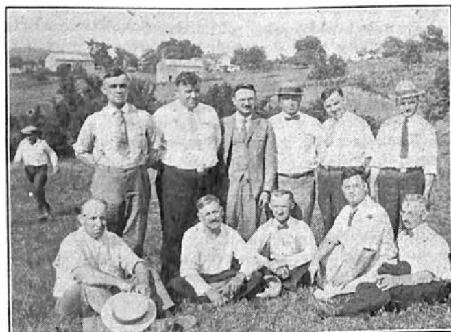
Členové Sokola Slávského na návštěvě v St. Louisu.

Milí bratři! Věřte, že jako hojivý balsám vlévala se ta vaše krásná slova do našich srdcí, vše co nás tíží jako by z nás spadlo a my povzbuzeni ještě více k další práci, která nás ještě očekává, jsme dnes pevněji odhodláni ji vykonati. A vy drazí bratři Sokola Slávského, kteří, jak nám již dlouho vědomo, jste vždy k naší jednotě lnuli pravou láskou bratrskou, jež zajistí i nám byla vždy oplácena, neb většina našich bratrů, kteří se od nás do Chicaga odstěhovali, se stali vašimi členy, děkujeme vám za vaši dalekou cestu, kterou jste vykonali, jak váš starosta nám pravil, ne, za nějakým výletem neb slavností, ale by jste byli svědky poctivě sokolské práce. Přijeli jste, by jste nás