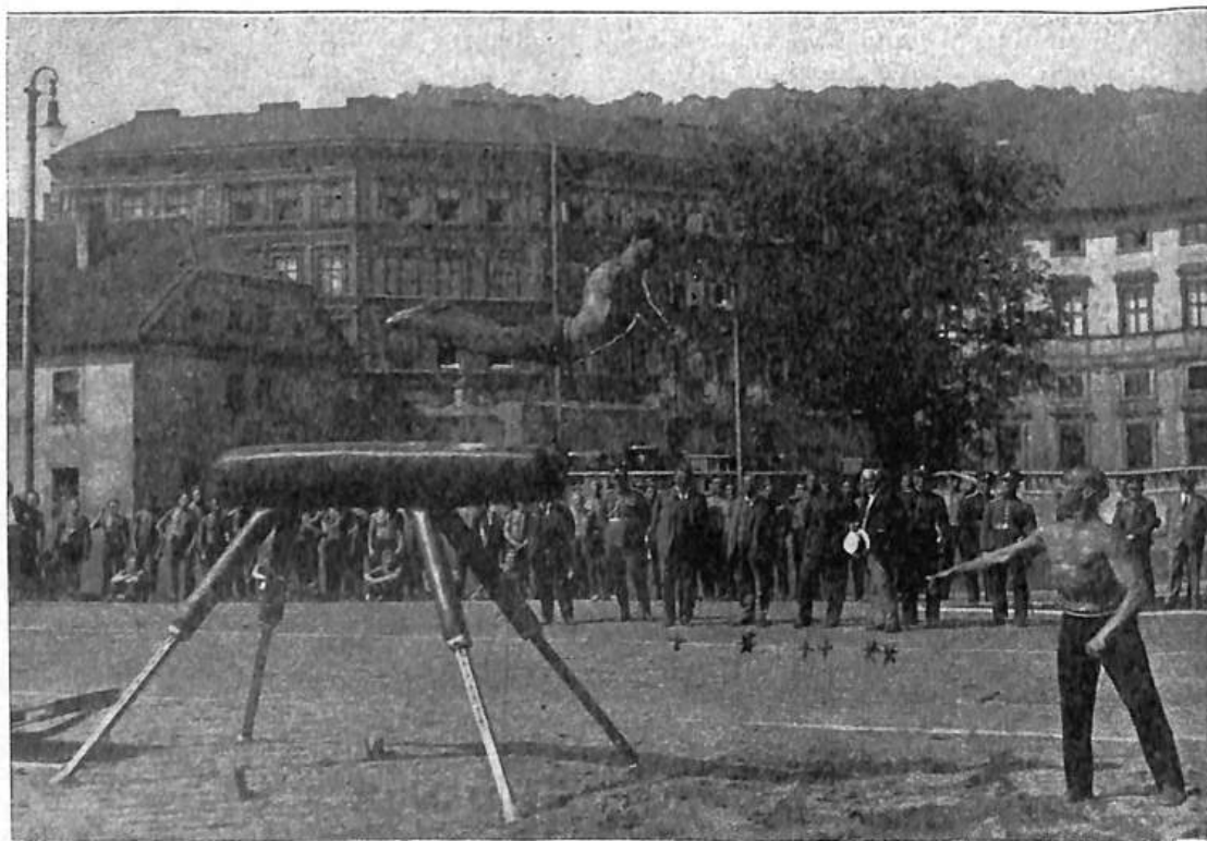
Z Tyršova domu v Praze: Jak se vzorné družstvo ČOS. připravovalo na zájezd do Ameriky r. 1929.

strength in his arm and his Country in his mind,” our Republic can face the future without fear, for there never will be an enemy strong enough that would dare to challenge such a Nation! These three things should be the attributes of every American citizen no matter where his cradle stood. In those words of Tyrš which inspired his Sokols to such heroic deeds can be seen the best preparedness for every Nation. A man with giant strength in his arm and with lion’s courage in his heart, may be a dangerous man to his country, if he is not Patriotic! These Gymnastic Institutions should not be places for physical training only, but that in these Institutions the strict rules of morality should be planted in the plastic mind of our youths, that our Gymnastic Institutions should be the Temples from which the laws of hygienic living are disseminated among the masses and—last, but not least—they should be hotbeds of the most intensive Patriotism!