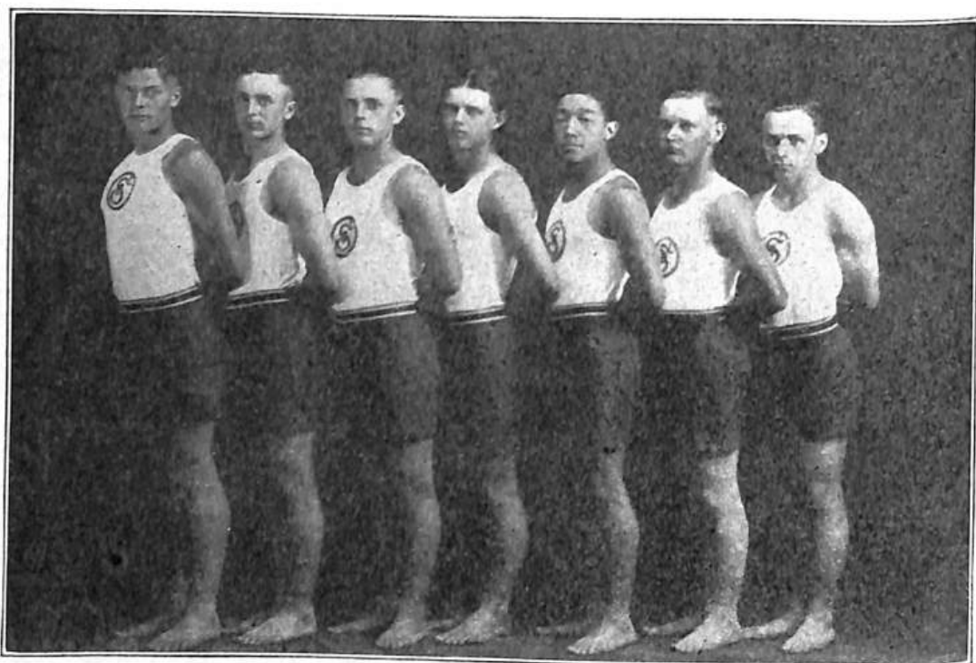
Dorostenci Sokola Cedar Rapids, Iowa, umístili se na třetím místě sletových závodů.