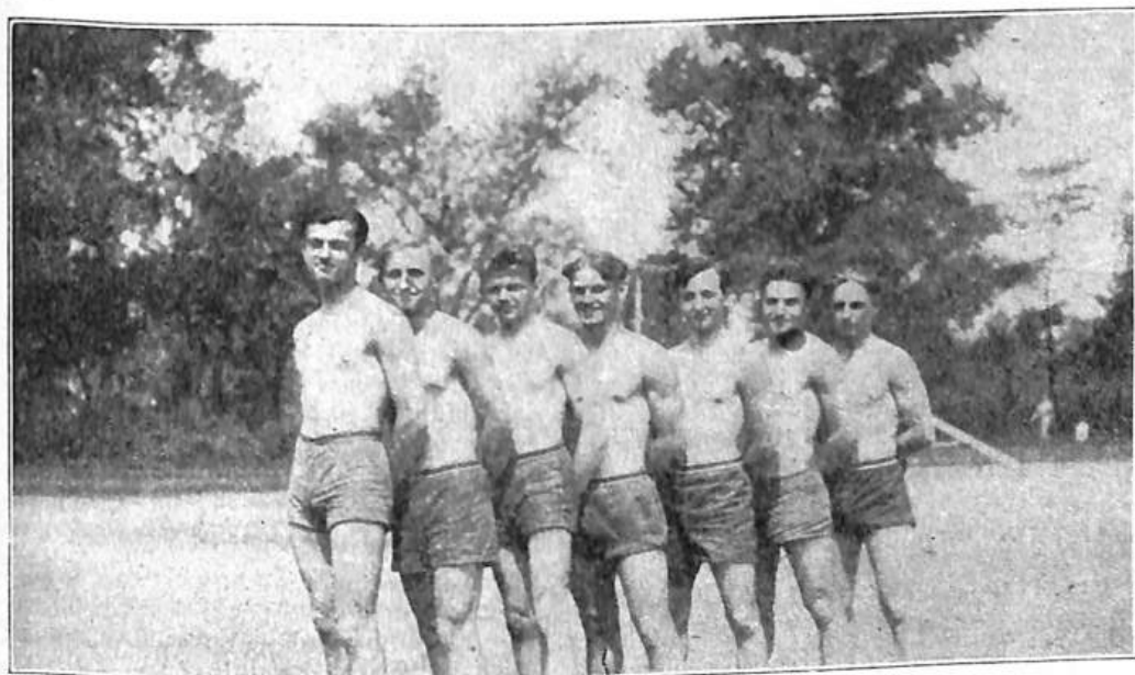
Družstvo dorostenců Sokola "Slávského" získalo I. ceny v závodech sletových.

able to command himself mentally, live honorably, and honestly, not for only himself, but for the whole.