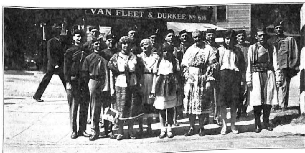
Skupina Jihoslovanů o "Slovanském dni," uspořádaném českým a jihoslovanským Sokolem 8. září 1929 na státní výstavě v Sacramento, Calif.