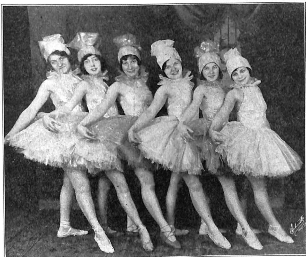
Sokolice v Baltimore, Md., při baletním čísle o sokolské akademii v pondělí 21. dubna 1930.