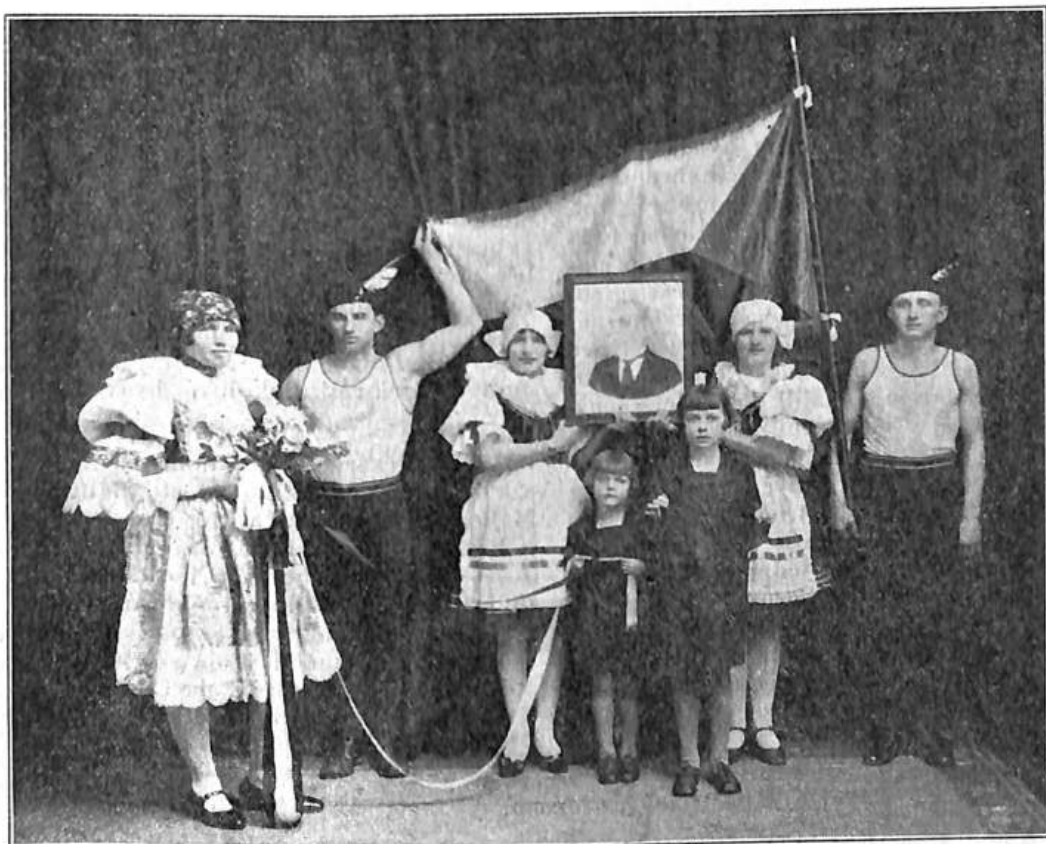
Čs. T. J. Sokol ve Winnipegu, Manitoba v Kanadě, oslavila 80. narozeniny T. G. Masaryka, presidenta ČSR., 7. března 1930.

Po této řeči, hojně aplaudované, dostal se do síně "Santa Claus", který podělal za pomoci sester veškerou sokolskou