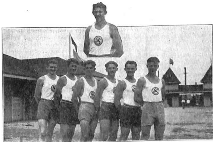
Dorostenci Sokola Town of Lake v Chicagu

K 17. září letošního roku je uloženo jednotám uspořádati přednášku: Význam dra Miroslava Tyrše pro naše národní osvobození. Tímto hromadným počinem všech jednot bude zahájena příprava členstva k roku 1932, v níž bude postup-