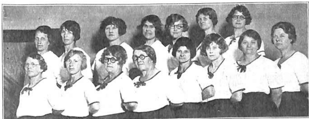
Skupina starších Sokolic v St. Paul, Minn., o sletu župy Severní 1930.

nature. The player on the other side is hidden from us. We know that his play is always fair, just and patient. But also we know, to our cost, that he never overlooks a mistake, or makes the smallest allowance for ignorance. To the man who plays well, the highest stakes are paid, with that sort of overflowing generosity with which the strong shows delight in strength. And one who plays ill