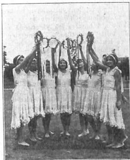
Naše Sokolice na Pacifickém pobřeží v Portland, Oregon.

A jest to jen zásluhou těchto průkopníků, že udržena jiskra nadšení pro ideu sokolské u nás do dnešního dne.