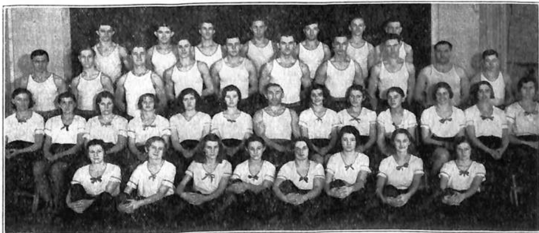
Účastníci cvičitelské školy Michiganského okrsku župy Severovýchodní ve dnech 19.-26. února 1932 v Toledo, Ohio.

Ježto však nakladatelství ČOS. má též knihkupectví, možno objednat u něho i literaturu, jež vyšla cizím nákladem. Příslušný obnos za objednané věci nutno však poslati předem s objednávkou a přidati také na poštovné. Objednávky adresujte: Nakladatelství Čs. Obce Sokolské, Újezd 450, Tyršův dům, Praha-III., Czechoslovakia, Europe.