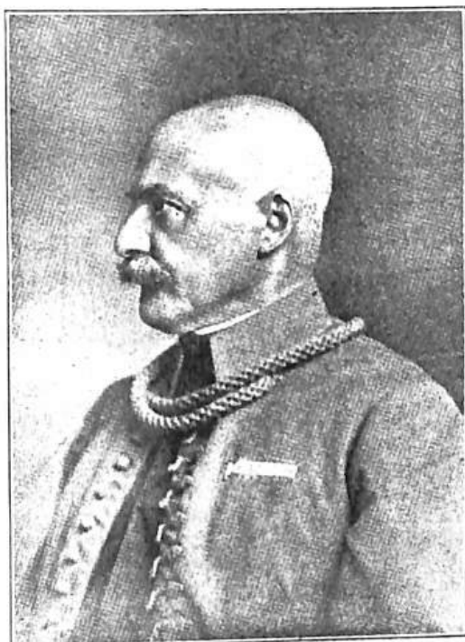
JUDR. JINDŘICH VANÍČEK * 1. ledna 1862—† 2. června 1934.