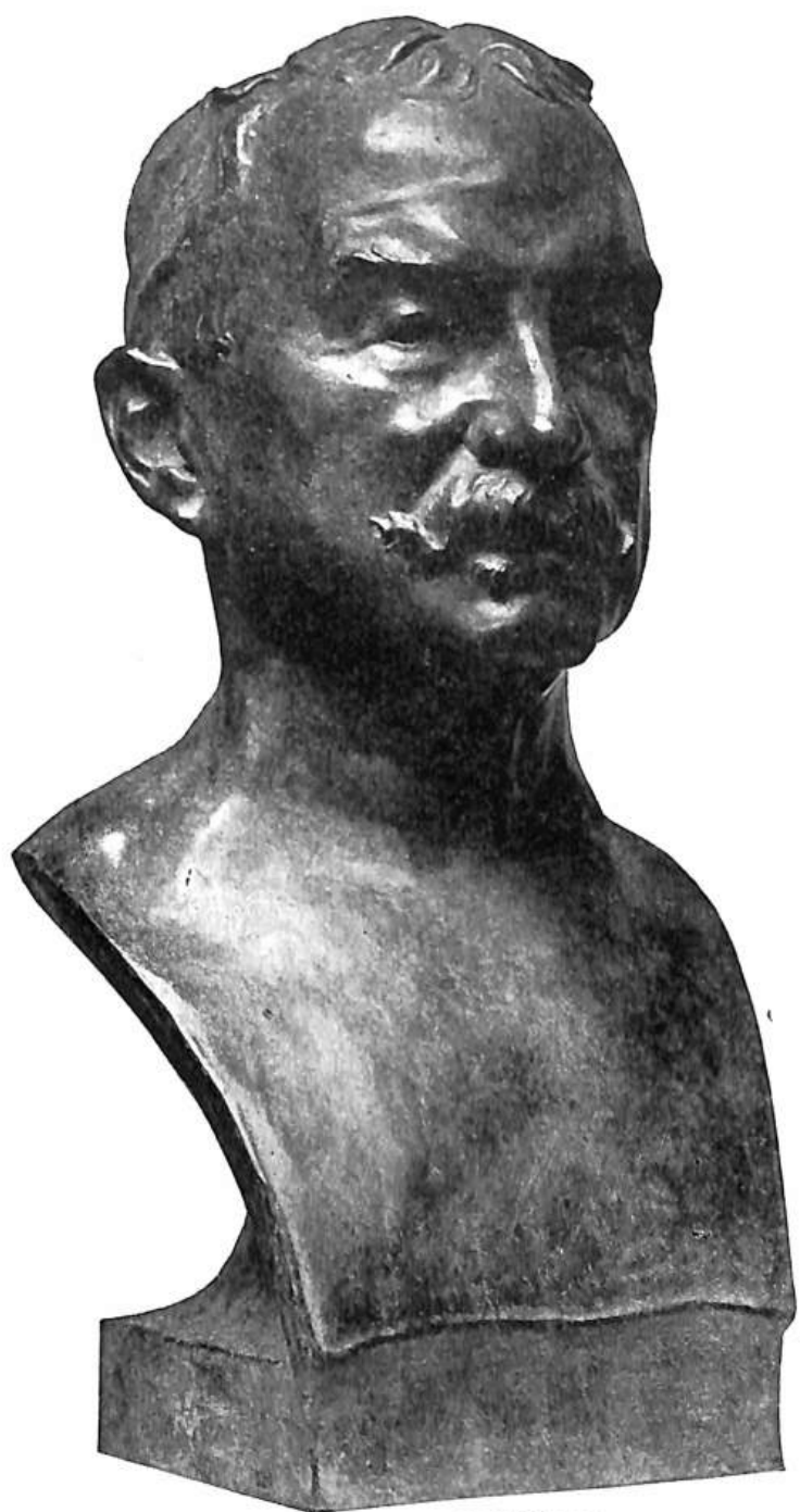
JINDŘICH VANÍČEK, bývalý náčelník Československé obce sokolské v Praze a Svazu slovanského sokolstva. * 1. ledna 1862—† 2. června 1934.