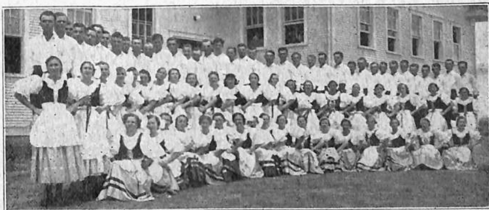
Tanečnice a tanečníci "Besedy" z Ennis, Texas.

locvičných čísel vyjímám pouze cvičení na hrazdě bratří z Dallas, kteří se osvědčili býti dobrými a vrcholovými hrazdáři. Jim vypomohlo několik bratří z Chicaga. Cvičení s kůželi, zacvičené bratry a sestrami ze Sokola Rozvoj, bylo skutečně hodnotné. Kroužení vynikalo vysokým výcvikem, zvláště různé mlýnky a závitky. Pro Texas to bylo nové a velmi vhodné. Kroužili bezvadně. Mocný potlesk ukázal, že se cvičení líbilo. Bradla chicagských byla též velmi dobrá. Velmi pěkně a svižně byla zatančena slovenská beseda kolonou bratří a sester z Ennis. Po programu byla přátelská zába-va a seznamování bratří a sester z různých