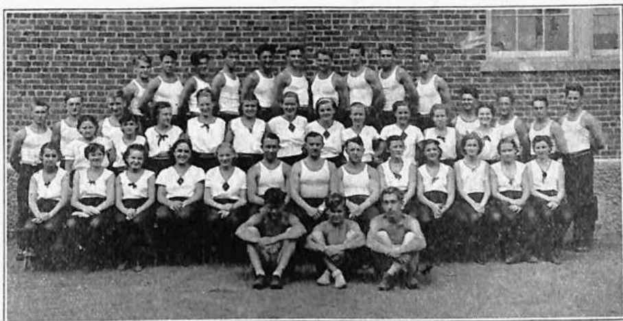
Cvičitel'ská škola v Little Ferry, N. J.