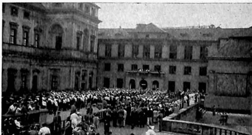
Uvitání Američanů v Tyršově domě v Praze.