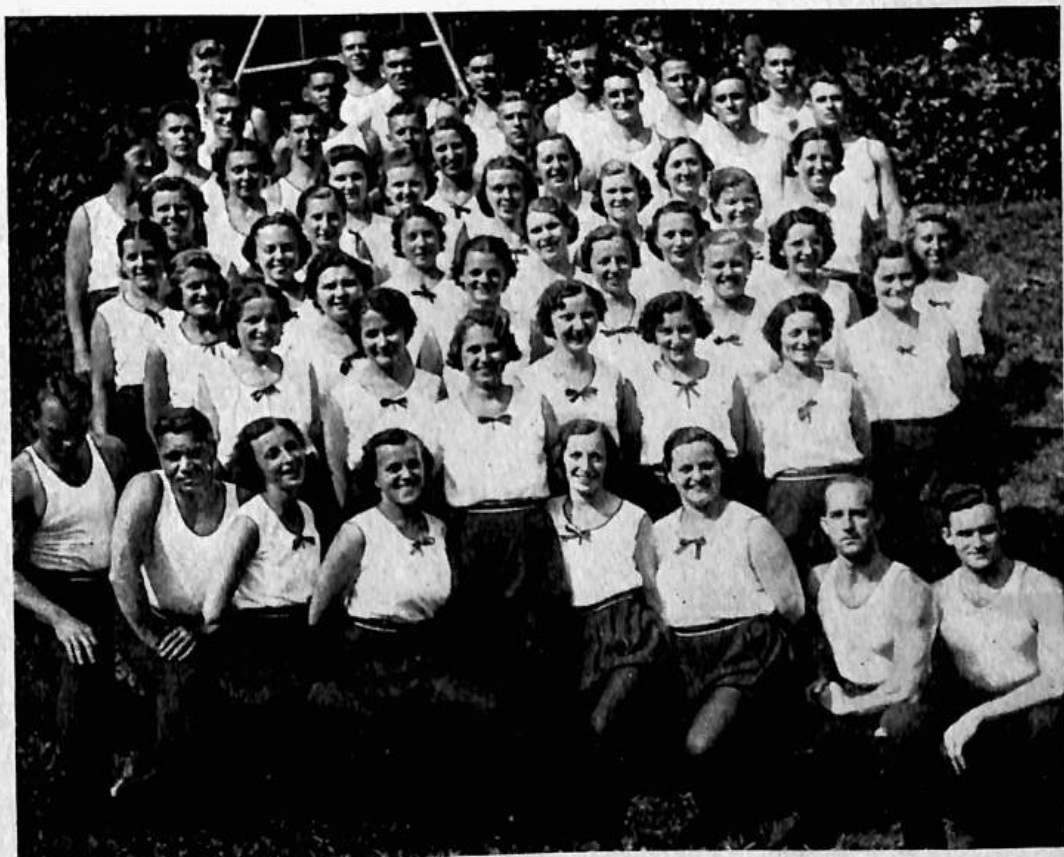
Četa Americké obce sokolské na X. sletu v Praze.

připojila se k nám výprava cvičících slovenského sokolstva, jeden bratr z Kanady a jeden Jihoslovan z New Yorku. Dle přesného programu závodní družstva i celek, za vedení určených vedoucích a přispěním br. Kosa, výcvik družstva rychle pokračoval a byl viditelný pokrok. Volné chvíle věnovány vycházkám, návštěvám jednot i vzpomínkovým návštěvám při položení věnců a vzdání pocty velikánům národním a sokolským. (Podrobnosti jsou v mé úřední zprávě pro AOS.)