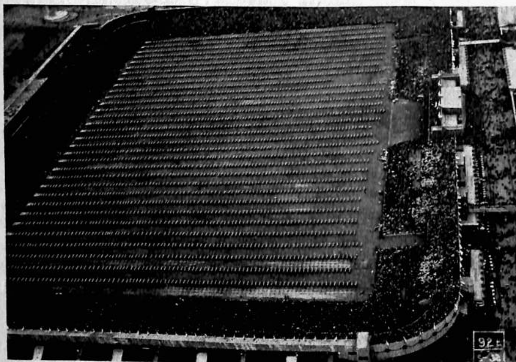
Sletový stadion v Praze zaplněný cvičícími i obecnstvem.

a dvě americká. I stupnice výkonů atletických zdála se býti vysoká pro ženy. Již jsem viděla mnoho závodů, ale tolik nul, zejména při atletice, jsem nespatriila nikde. Ze všech závodnic jen asi tři docílily nějaké body na běhu, jinak jen nuly. To neprospěje a nepovzbudí. Nu naše četa při běhu měla též samé nuly a přece se dostala na druhé místo. Nechtěla jsem věřit v tento výsledek. Ovšem, všichni měli jsme radost z vítězství družstva mužů a čtyř žen, proto hned jsem poslala telegram do Ameriky. Slovenské družstvo z USA. bylo čtvrté. Družstvo mužů za STJS. závodilo ve vyšším oddělení s menším štěstím. (Pokrač.)