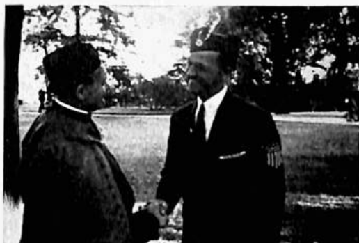
Se starostou ČOS. 7. července 1938 v Praze.