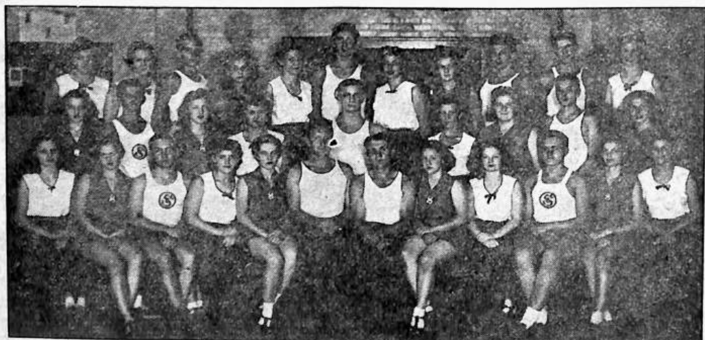
Cvičitelská večerní škola v Cleveland, Ohio.

Agitujme! Ziskávejme nové cvičící. Přesvědčme je o významu tělocviku, pro zdraví i praktický život vůbec a ze stanoviska vlastenecké povinnosti. Řádně vedené cvičební hodiny vzbudí zájem a potvrdí hodnotu tělesné výchovy. Agitujme! Cvičme! Udržme cvičící v tělocvičně správným tělocvikem!