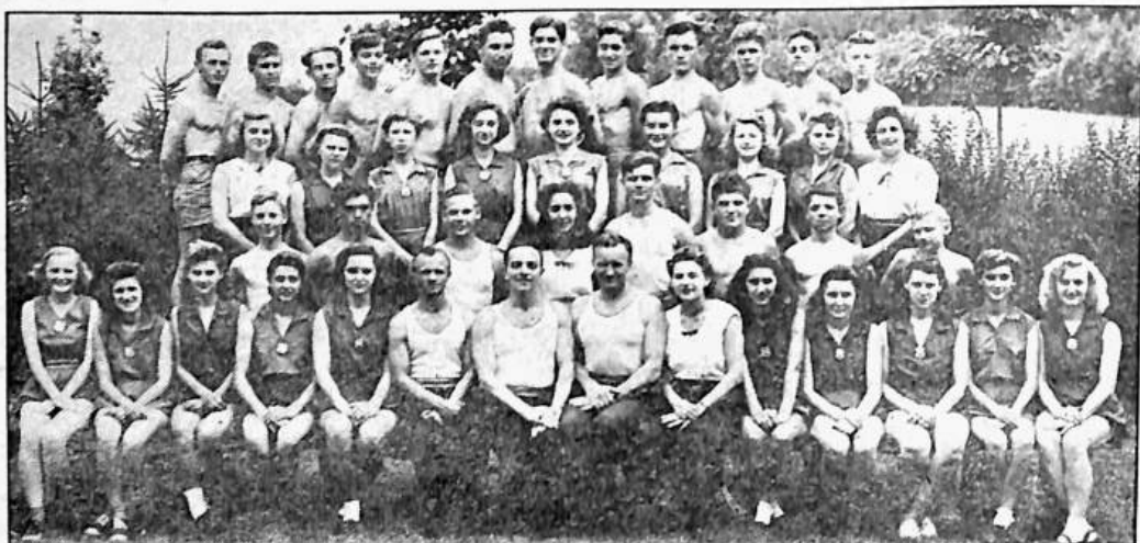
Cvičitelská škola v Boonton, N. J.