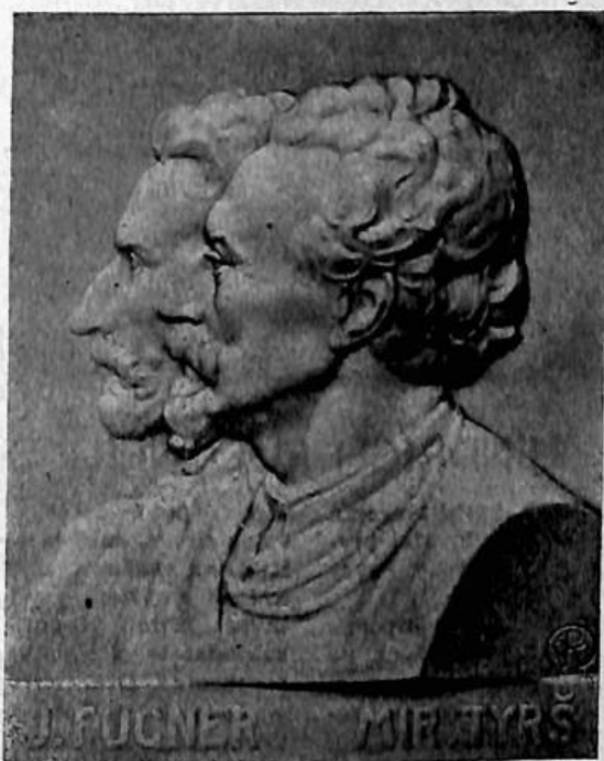
JINDŘICH FUEGNER, narozen 12. září 1822 v Praze.

V měsíci září neopomeňte vzpomenouti důstojným způsobem narozenin dvou nesmrtelných tvůrců Sokolstva: