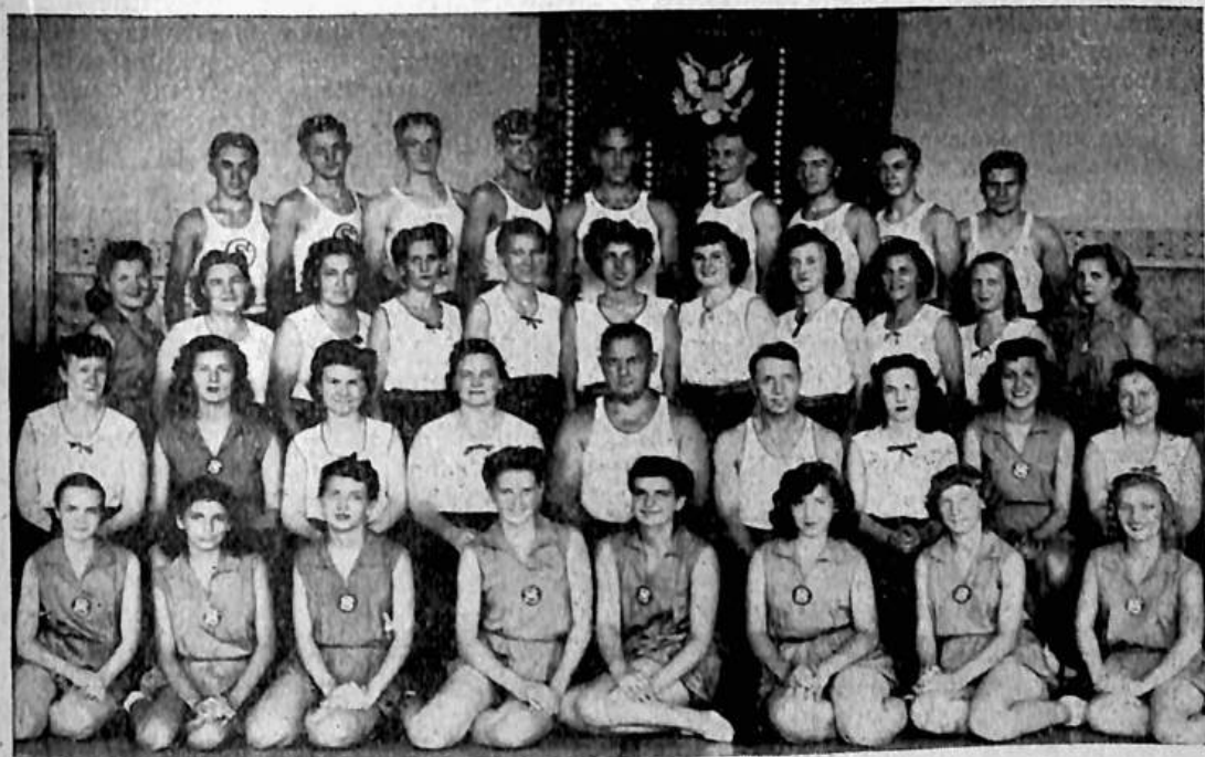
Cvičitel'ská škola župy Severovýchodní A.O.S. v Clevelandu 1944.

Kurs nedokončili, jak dříve naznačeno, 3 ženy, 1 dorostenka a 1 dorostenec.