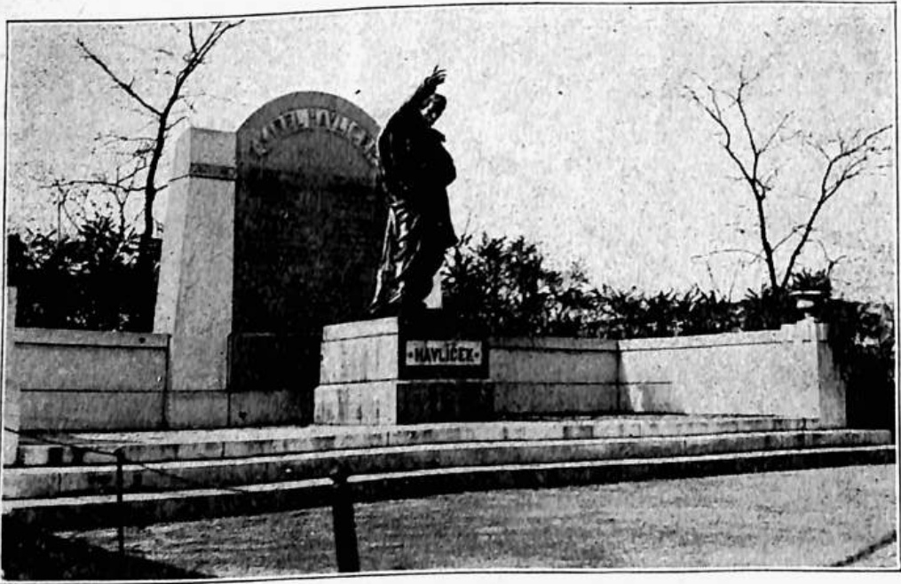
Pomník Karla Havlíčka v Douglas Parku v Chicagu.