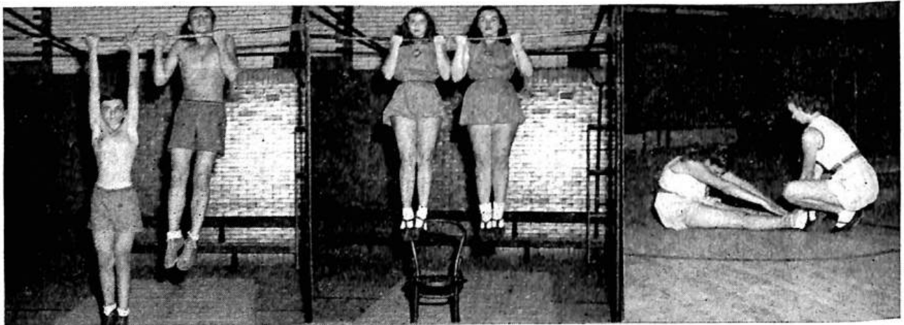
4. Chins - boys and men