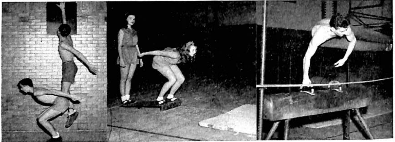
1. Vertical jump

Obrázky sedmi předmětů ve zkoušce jsou zde. Vizte vysvětlení v Sokole Americkém v říjnovém čísle.