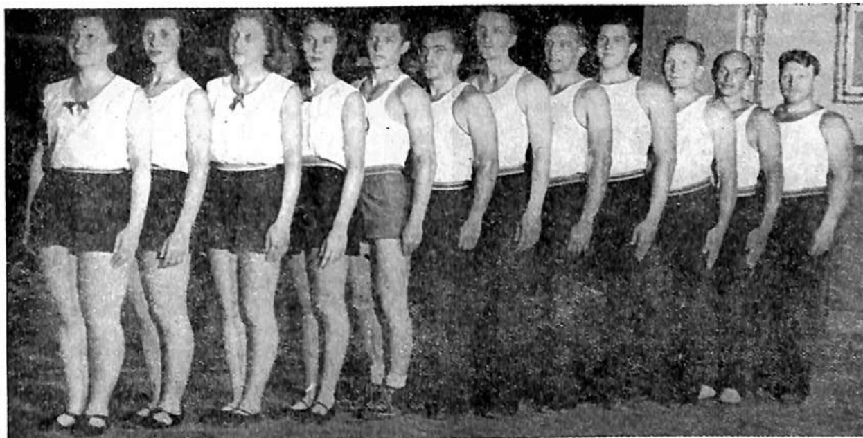
Někteří z účastníků a učitelů večerního kursu župy Střední.