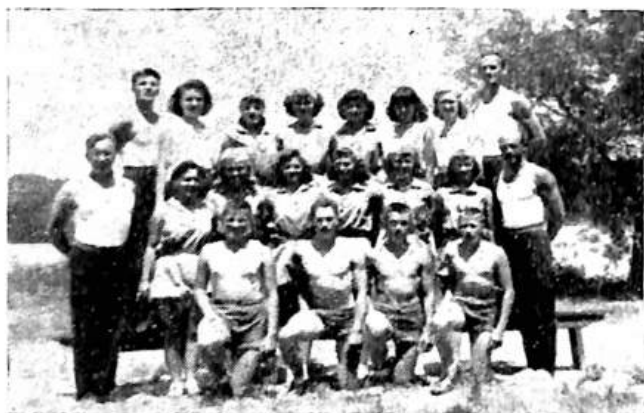
Hořejší obrázek: Účastníci kursu župy Severozápadní.