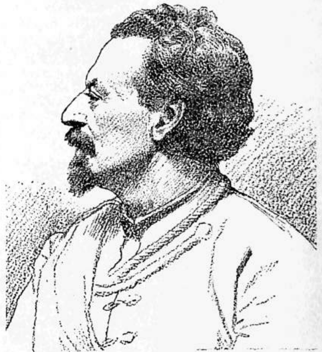
Dr. Miroslav Tyrš, the Founder of Sokol.

Educational and Physical Culture Association