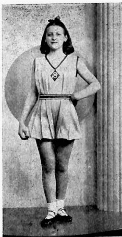
Jak vyhlíží sokolská evičenka (žákyně 6 až 13 roků).

Educational and Physical Culture Association