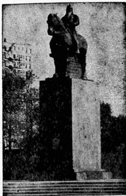
T. G. Masaryk Memorial in Chicago

Educational and Physical Culture Association