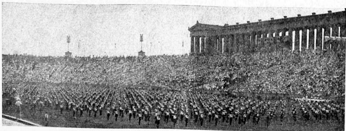
AMERICAN SOKOL SLET AT CHICAGO, ILLINOIS, 1941

Headquarters: NATIONAL HALL, 1701 ALLEN AVE., ST. LOUIS, MO. Tel.. PROspect 6-8360