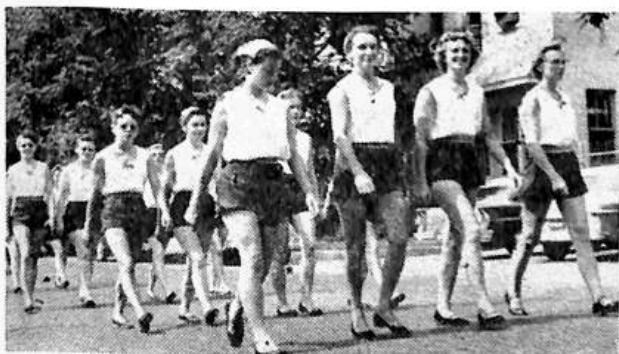
Sokolice ve slavnostním průvodu městem.

zkoušek po celé dopoledne. V hodinovém rozvrhu cvičila jedna skupina za druhou při teplotě, jež se pohybovala mezi 80 a 90 stupni a mohu říci, že mezi Sokolstvem převládala vzorná kázeň. Každý byl na svém místě, nikoho nebylo třeba na poslední chvíli shánět. To byl první základ úspěšného vystoupení odpoledne. S mnoha stran ozýval se zpěv a radostná nálada převládala všude. V poledne cvičící byli překvapeni chutným, vydatným jídlem pro ně připraveným. Obrovská hovězí kýta do zlatova upečená a několik šunek padlo za obět' zdravému apetitu chlapců a dívek, jenom lze litovat nedostatků nápojů během programu. Ve stadionu je však výsadní právo k prodeji občerstvení, našemu výboru to dovoleno nebylo a měl za to, že vše bude obstaráno. Skoda.